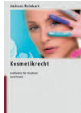
Andreas Reinhart Kosmetikrecht

Das deutschsprachige Nachschlagewerk 2009 liefert umfassende Informationen über aktive Firmen in der Körperpflege-, Wasch- und Reinigungsmittel-Industrie: 698 Hersteller/Importeure/Großhändler, 57 Lohnhersteller, 22 Servicefirmen, 45 Zulieferer für Rohstoffe; 27 Verbände und Organisationen und 54 Pressepublikationen. Die Printausgabe enthält die Standard-CD-ROM mit verknüpfter Suchfunktion. Die Printausgabe mit Marketing-CD-ROM ermöglicht den Datenexport. 20. Ausgabe, 316 Seiten, broschiert, DIN A4 inkl. Standard-CD-ROM, 366,00 € inkl. Marketing-CD-ROM, 1.058,51 €