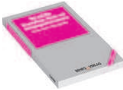
Wer und Was Körperpflege