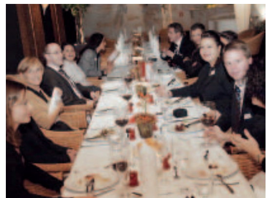
Gemütliches Beisammensein in gediegenem Ambiente