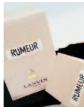
Imaginäre Zeitungstexte in Tiefprägung

Faszinierend schattiert ist die Faltschachtel von „ Noa Perle “, dem neuen Damenduft von Cacharel . Durch das grünlich-violette Farbenspiel auf ihren Seitenflächen entsteht eine optische Täuschung, die eine schillernde Perle auf den Karton projiziert. Um diesen vibrierenden, perlmuttfarbenen Glanz zu erzielen, hat La Spic eine registergenaue Hologrammfolie auf den Karton aufkaschiert, die die Kugelform des Flakons dreidimensional widerspiegelt.